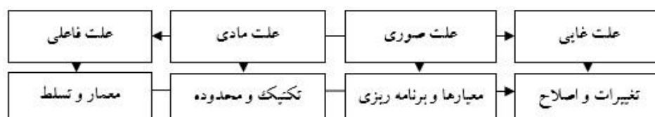
«تصویر ۴»: معیارهای انعطاف‌پذیری در معماری در رابطه با اسم جبار، ترسیم: نگارنده